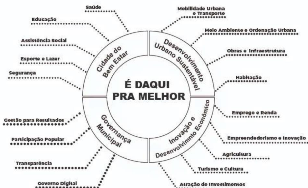
Figura 2: Eixos Estratégicos (PPAG 2026-2029)

Além dos Eixos Estratégicos há, ainda, conforme visto na figura 2, as respectivas dimensões, a saber: a) Eixo 1 (Cidade do Bem Estar): Saúde, Educação, Assistência Social, Esporte e Lazer e Segurança; b) Eixo 2 (Desenvolvimento Urbano Sustentável): Mobilidade Urbana e Transporte, Meio Ambiente e Ordenação Urbana, Obras e Infraestrutura e Habitação; Eixo 3 (Inovação e Desenvolvimento Econômico): Emprego e Renda, Empreendedorismo e Inovação, Agricultura, Turismo e Cultura e Atração de Investimentos e d) Eixo 4 (Governança Municipal): Gestão para Resultados, Participação Popular, Transparência e Governo Digital.